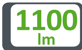
GRAFICO DIFFUSIONE LUCE